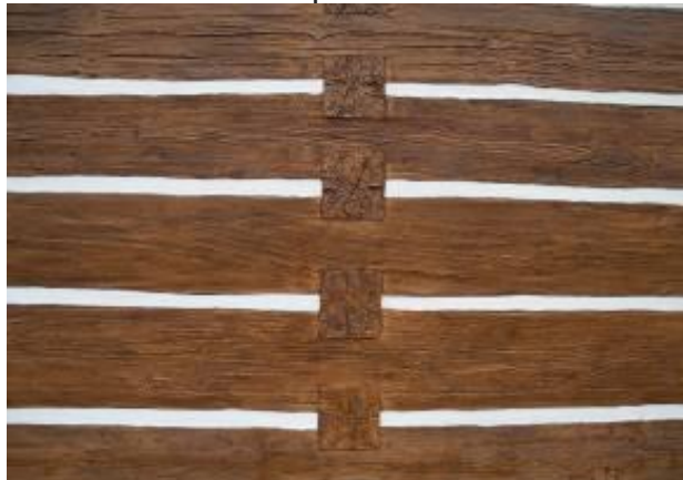
Obr. 3 – Zakotvení příček