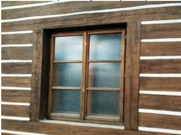
Obr. 5 – Sloupková špaleta (detail)