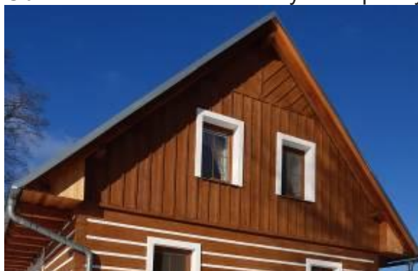
Zdobení štítu – překrývací latě spár