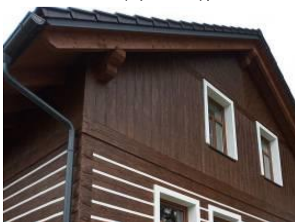
Obr. 4 – Hladký (skládáný) štít