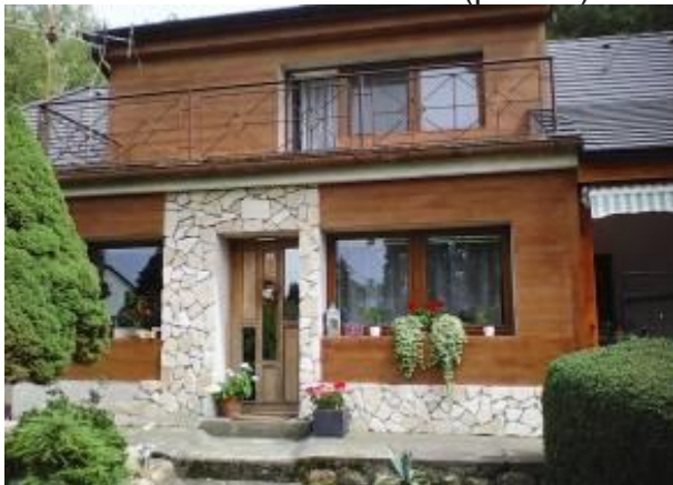
Obr. 7 – Moderna – bednění (plocha)