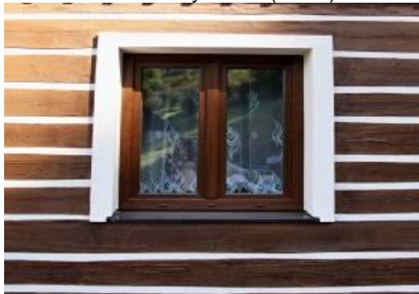
Obr. 13 – Šambrány rovné (detail)